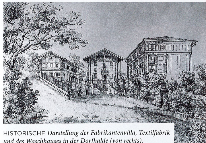
HISTORISCHE Darstellung der Fabrikantenvilla, Textilfabrik und des Waschhauses in der Dorfhalde (von rechts).