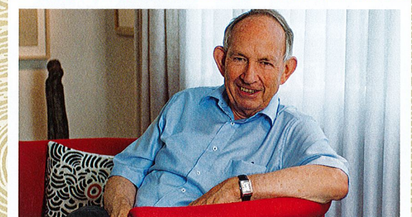
Eine Auswahl der Glossen von Eugen Auer ist in Buchform erschienen. «Ein Appenzeller namens...» Band 4 und 5 sowie eine CD sind in Buchhandel oder auf verlagshuus.ch erhältlich.