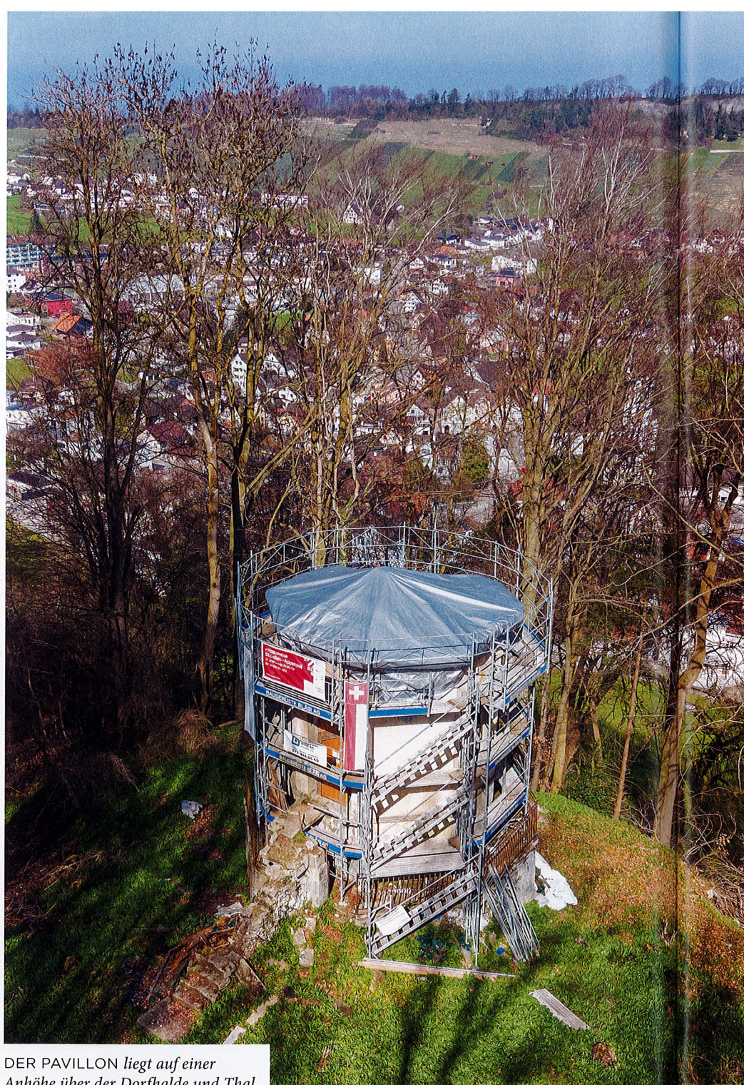
DER PAVILLON liegt auf einer Anhöhe über der Dorfhalde und Thal.